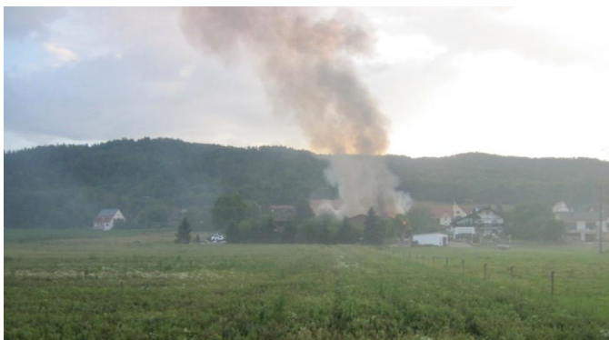
Bild links: Bereits auf der Anfahrt konnte man von Weitem die enorme Rauchentwicklung sehen.

Dies war eine nicht zu unterschätzende sehr wichtige Maßnahme.