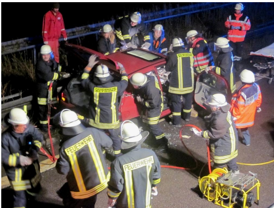
Bild links: Verkehrsunfall auf der Autobahn mit eingeklemmter Person. Für den Laien ist ein geordneter Rettungsablauf oft nur schwer zu erkennen.

07:00 Uhr: Nach knappen zwei Stunden Einsatzende.