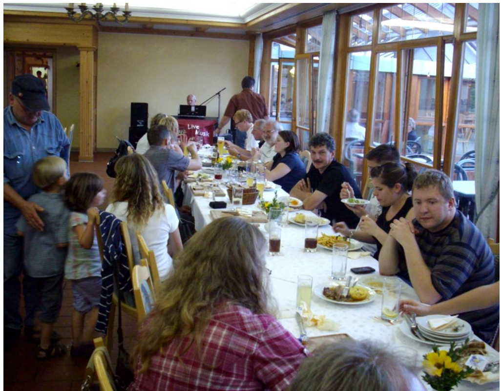
Bild unten: Gemütlicher Ausklang beim Abendessen und anschließender Live-Musik

Dort klang der Abend nach einer zünftigen Brotzeit bei Musik von einem Alleinunterhalter langsam aus, bevor es wieder zurück nach Altdorf ging.