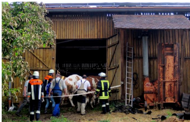
Bild links: Nach rund drei Stunden konnten die Tiere wieder zurück in den Stall getrieben werden.

Bild oben: Vorläufig wurden die Kühe auf eine eingezäunte Weide neben dem Anwesen untergebracht.